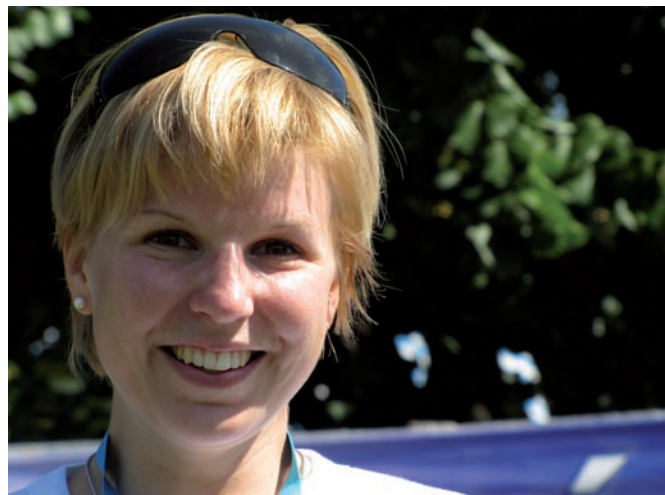
ein strahlendes Siegerlächeln

Herzlichen Glückwunsch zu diesem sensationellen Erfolg!